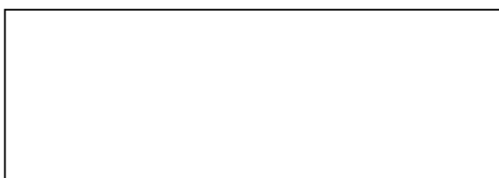
Схема границы балансовой принадлежности тепловых сетей

_____ (адрес, наименование объекта и оборудования, по которым определяется граница балансовой принадлежности тепловых сетей)